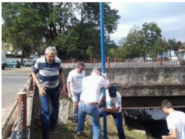
Ponte do SUS