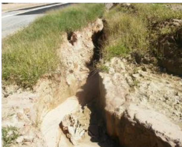
Páteo do Colégio (Scopel)