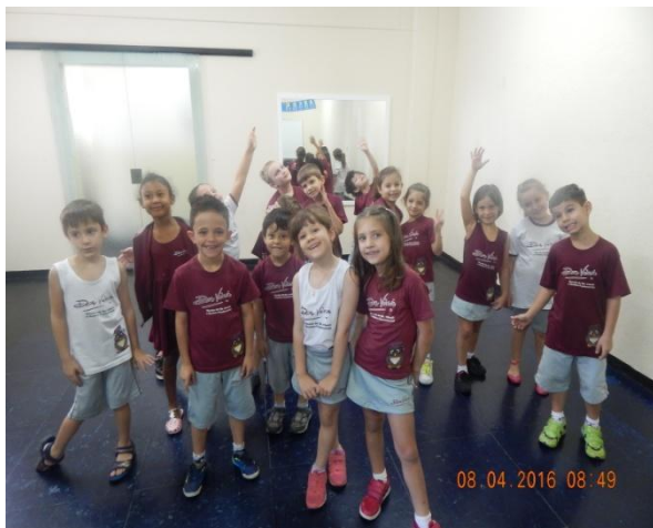
(turma da manhã)