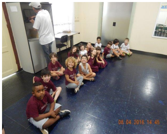
(turma da tarde)